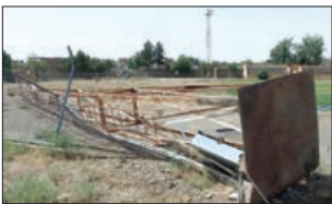
عکس مربوط به سال ۹۰