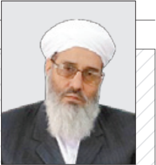
«گزارشی از جشنواره «مسجدی ها» که ظرفیت های هنری مردم مشهد را پای کار آورده است