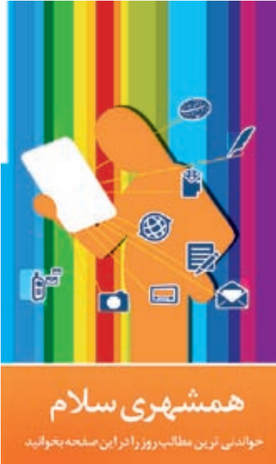
خواندنی ترین مطالب روز را در این صفحه بخوانید.

به گزارش روابط عمومی سازمان حج و زیارت خراسان رضوی، در این دوره متقاضیان تشرّف به عتبات عالیات، از ساعت صبح روز امروز ۲۰ بهمن‌ماه تا ساعت ۱۶ روز سه‌شنبه ۲۷ بهمن‌ماه به‌آدرس اینترنتی www.atatbat.haj.it مراجعه و نام‌نویسی و کد رهگیری دریافت کنند. روز پنج‌شنبه ۲۹ بهمن‌ماه قرعه‌کشی بین متقاضیان انجام می‌شود و نتیجه آن روز شنبه اول اسفندماه روی سامانه پیش ثبت‌نام عتبات عالیات قرار می‌گیرد. متقاضیان می‌توانند با مراجعه به سایت مذکور از نتیجه و زمان ثبت‌نام در کاروان‌ها مطلع شوند. براساس این گزارش، افرادی که مبادرت به ثبت‌نام گروهی ۲۵ نفره می‌کنند، در صورتی که تعدادی از آنها منصرف و از گروه خود خارج شوند و تعداد اعضای گروه آنها کمتر از ۲۵ نفر شود، گروه مذکور حذف می‌شود و در قرعه‌کشی شرکت داده نخواهد شد.