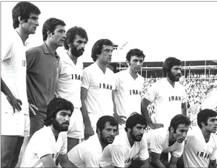
تیم ملی ایران در جام جهانی ۱۹۷۸