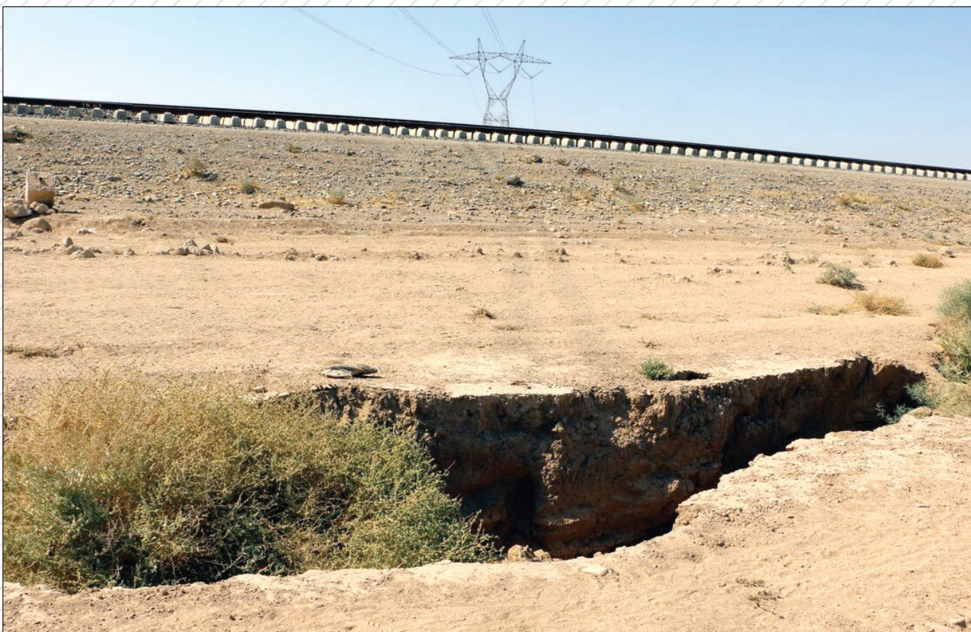
شکاف عمیق ناشی از فرونشست در منطقه ابردژ و رامین در نزدیکی راه آهن سراسری مشهد - تهران در سال ۹۸