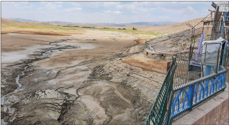
نمایی از سد خشک شده فریمان

در حالی که رف‌ع تنش آبی مشهد حداقل به هزار میلیارد تومان اعتبار نیاز دارد، تنها ۱۳۶ میلیارد در بودجه ۱۴۰۱ برای استان در نظر گرفته شده است، آیا برش استانی اعتبارات این خلأ را جبران می‌کند؟