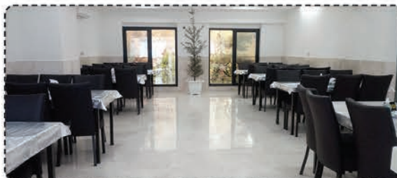
چلو کباب امید / شعبه اصلی، خیابان دانش