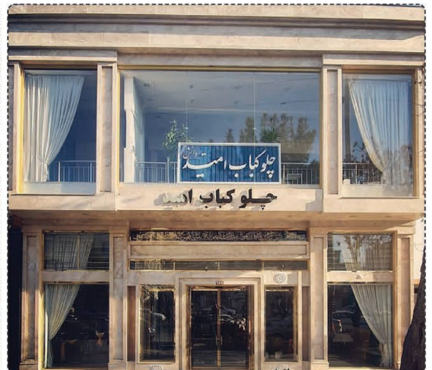
چلو کباب امید / شعبه هفتم تیر / بین ۱۸ و ۲۰