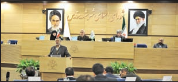
نمایندگان شورای شهر

بررسی لایحه دریافت پول از مشهدی ها در ازای خدمات شهروندی به جلسات بعد مو کول شد