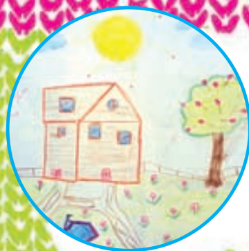
کیانا اسماعیل پور