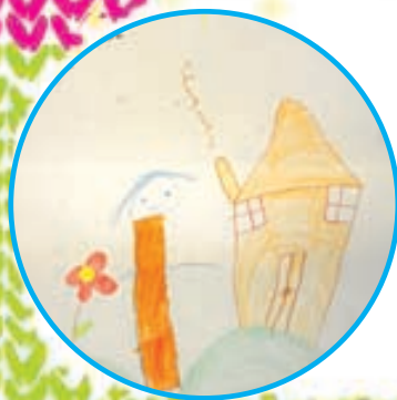
فاطمه عظیمی عصمتی