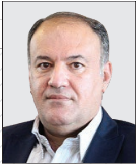
رئیس سازمان امور عشایر کشور خبر داد:

شاخص بر خور داری عشایر از آب بهداشتی به ۶۳ درصد رسید