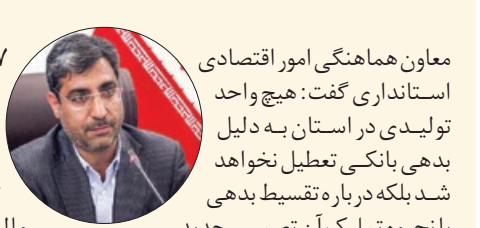
معاون هماهنگی امور اقتصادی استاندار

هیچ واحد تولیدی بدهکار بانکی تعطیل نمی شود