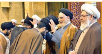
۲۰۰ طلبه حوزه علمیه خراسان به لباس روحانیت ملیس شدند

در این دیدار، مدافعان حرم را ادامه دهندگان راه حضرت فاطمه زهرا(س) در دفاع از حرم ولایت دانست و ابراز کرد: شهدای مدافع حرم همچون فاطمه زهرا(س) جان خود را در راه دفاع از ولایت نثار کردند. تولیت آستان قدس بایان این که مابه مرزهای جغرافیایی اعتقادی نداریم؛ مرز ما، مرز میان ایمان و کفر است، بیان کرد: خانواده شهدای فاطمیون علاوه بر تحمل سختی غربت، شهادت عزیزان خود را نیز تحمل می کنند و این سختی دوچندان است. اما با این حال اجازه ندادند حرامیان داعشی به مرقد مطهر دختر فاطمه زهرا(س) نزدیک شوند و جسارت کنند. حجت الاسلام والمسلمین مروی با بیان این که عزیزان شما اجازه بی احترامی به زینب کبری(س) را ندارند و با نثار جان خود از حریم اهل بیت(ع) دفاع کردند، ابراز کرد: شما هیچ تفاوتی با مادران و همسران شهدای واقعه کربلا ندارید و مطمئنا اگر در کربلا نیز بودید حضرت زینب(س) را تنها نمی گذاشتید، شما در پیشگاه اباعبد... (ع) و حضرت زینب(س) روسفید هستید.