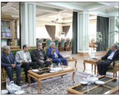
استاندار در دیدار با رئیس سازمان امور عشایر کشور: