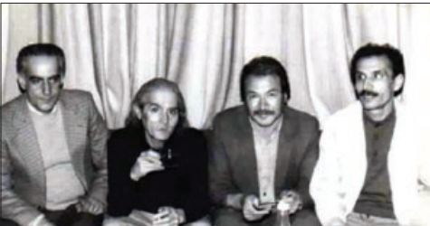
قاب مشترک مر حوم تقی خاوری و اخوان ثالث

در گذشت مر حوم تقی خاوری را تسلیت گفت. در بخشی از متن پیام آفشنین تحفه گر آمده است: ... با نهایت تأسف، خبر در گذشت شاعر بلند آوازه خطه خراسان، مر حوم تقی خاوری، باعث تأسف و تأثر عمیق گردید. شاعری بزرگ و فرهنگ دوست که تمام عمر با برکت خود را در راه اعتلای شعر خراسان صرف کرد. او هرگز در راه اعتلای شعر اندشگاهی نداشت اما به واسطه مطالعات و تحقیقات وسیع و پرمایه و مر او ده با بزرگانی چون اخوان ثالث، محمد قهرمان و... در مدت زمان کوتاهی به جایگاهی در شعر سپید خراسان رسید که نشان از نبوغ اندیشه و قلمش داشت. جایگاهی که از او یک شاعر سپید سرای تکرار نشدنی ساخت...»