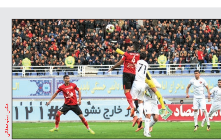
عکس شهید هفتابی

رئیس فدراسیون تنیس روی میز هم در این مجمع گفت: تا پایان آذر ماه، ۲۵۰ میلیون تومان در ۹ ماه هزینه عوارض خروج از کشور دادیم که برای فدراسیون تنیس روی میز مبلغ زیادی به شمار می‌آید. قارداشی افزود: طی سه سال گذشته از جمله اقدامات مثبتی که در فدراسیون صورت گرفته، ارتقای رتکینگ تیمی و انفرادی ورزشکاران جوان و بزرگ سال کشور مان بوده‌است. قارداشی با اشاره به جذب حامی مالی بیان کرد: مشکل عمده فدراسیون‌های ورزشی جذب حامی مالی است که با حمایت رسانه ملی و پخش تلویزیونی مسابقات ورزشکاران آقا و خانم ما را در جذب حامی مالی یاری کردند.