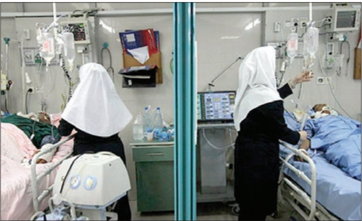
عکس تزیینی است

بیماران سپری نشد، چه محرم هایی که دوست داشتیم در مجلس عزای سیدالشهدا(ع) باشیم اما این جا به بیماران خدمت کر دیم و چه اتفاقات کوچک و بزرگی که در زندگی عزیزانمان رخ داد و ما ماجل حضور در آن را از دست دادیم. خلاصه این شعار نیست که این حرفه با مفهوم «ایثار» پیوند خورده است. اوتاکید می‌کنم: حرفه پرستاری در هر بخش یا مرکز درمانی که باشد، به نوعی مهجور است. شیفت های سنگین، بیماران بدحال، بی احترامی به پرستارن و... تنها بخشی از مشکلات ماست. تلاش خودمان این است که صبرمان را بالا ببریم. روزی که قران بود به این بخش منتقل شوم، نگران دشواری های کارش بودم اما حالا خدا را شکر می‌کنم. فکر می‌کنم این فرصت را خدایه من داده تا کاری انجام دهم که به یک تغییر خوب در زندگی آدم های دیگر منجر می‌شودو چه چیزی بهتر از این؟