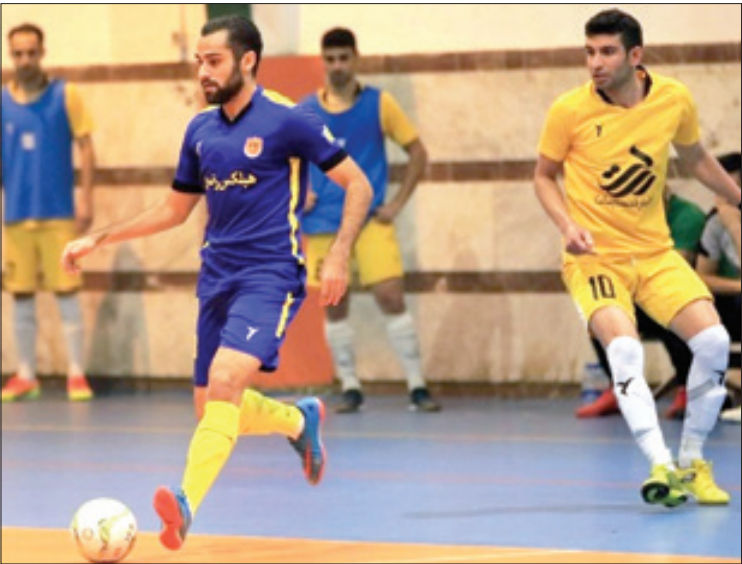
بازی فوتبال در مشهد