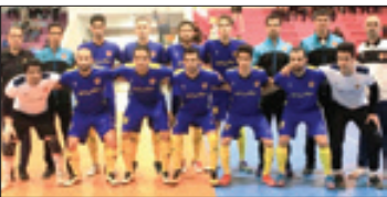
بازیکنان تیم فوتبال خراسان