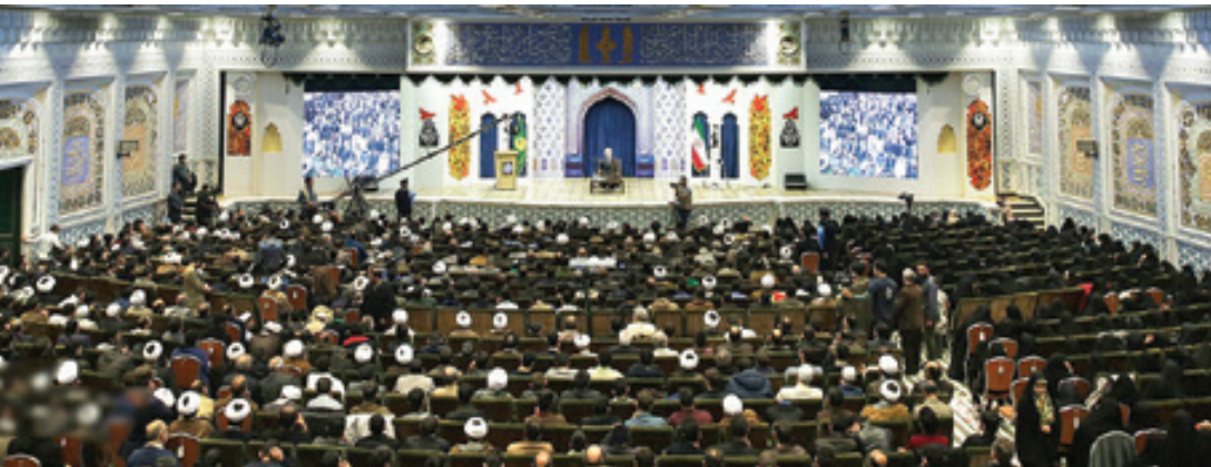
عکس از استان بوشهر

بزرگداشت آیت ا... «سیدعلی قاضی»، عارف و استاد برجسته اخلاق بر گزار شد