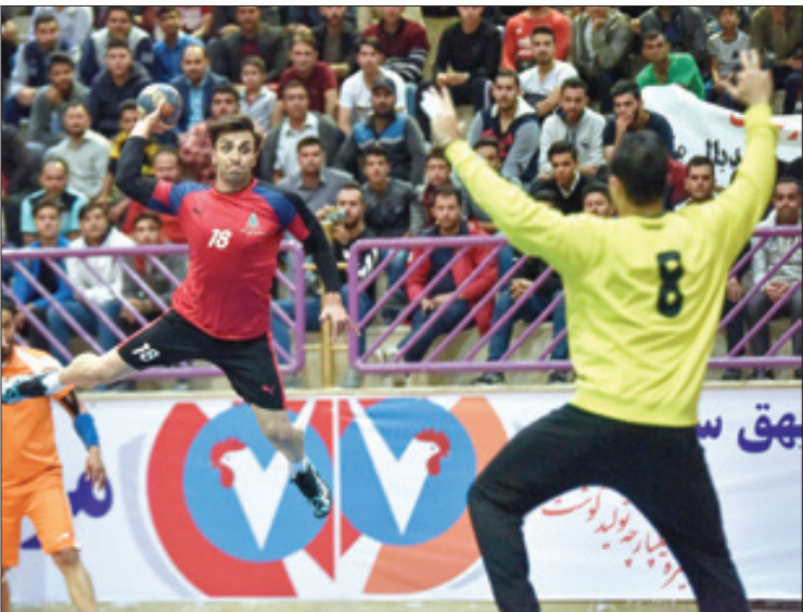
بازی هندبال سبزوآر در مقابل فولاد مبارکه

سر مربی تیم: پیروزی در مسابقه امروز در سبزوآر، ما را از بحران خارج می کند