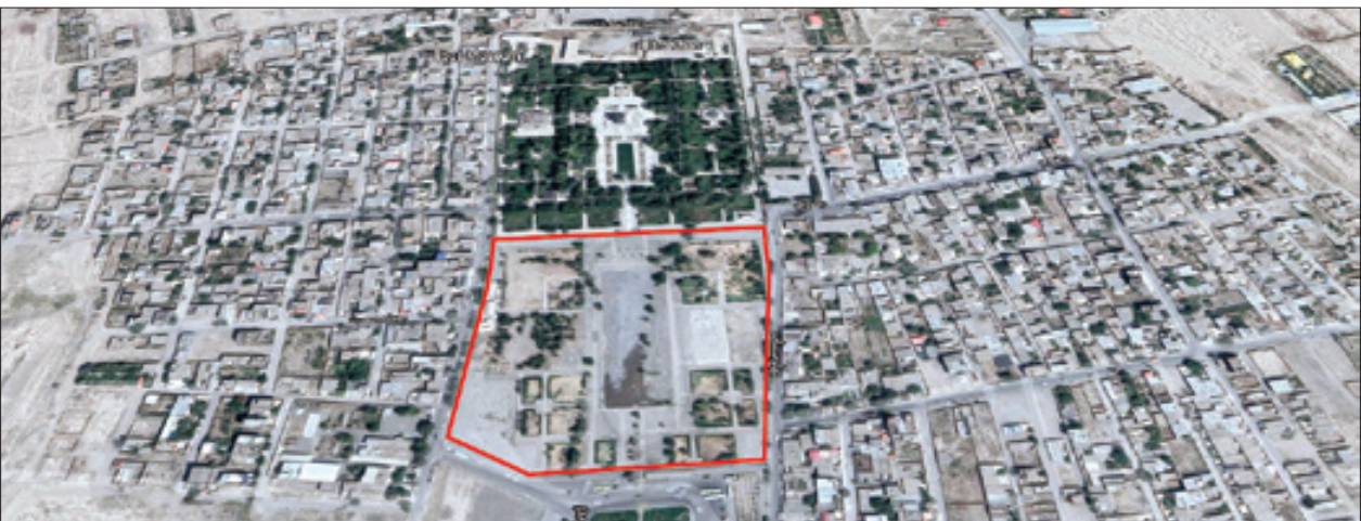
محدوده جلوخان آرمگاه فردوسی روی نقشه ماهوار های گوگل

توانند مناصره را بر گزار و پیمانکار را انتخاب کند. روند قانونی اجرای کار در حال طی شدن است و بحث‌های اسناد مناصره را پیگیری می کنند، در نهایت فکر نمی کنم تا اجرای کار زمان زیادی باقی مانده باشد.