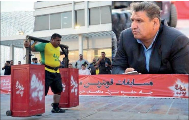
یک مرد نیمه حرفه‌ای

- مسابقات برگزار شده در شاندیز، در سطح قابل قبولی از رقابت های مشابه برگزار شد و بسیاری از ورزشکاران حاضر آمادگی بدنی و جسمانی بسیار خوبی داشتند و کمیته قوی ترین مردان هیئت بدنسازی و پرورش اندام خراسان رضوی نیز زحمات خیلی زیادی کشید که باعث شد مسابقات در حد خوبی باشد.