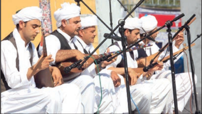
امسال آغاز سال تحصیلی جدید در دانشگاه با اجرای گروه موسیقی تربت جام‌پور از هوای خراسانی داشت

علیرضا فغانی، داور خراسانی را جع به انتخاب‌ش به‌عنوان داور دیدار استقلال و پرسپولیس واکنش نشان داد.