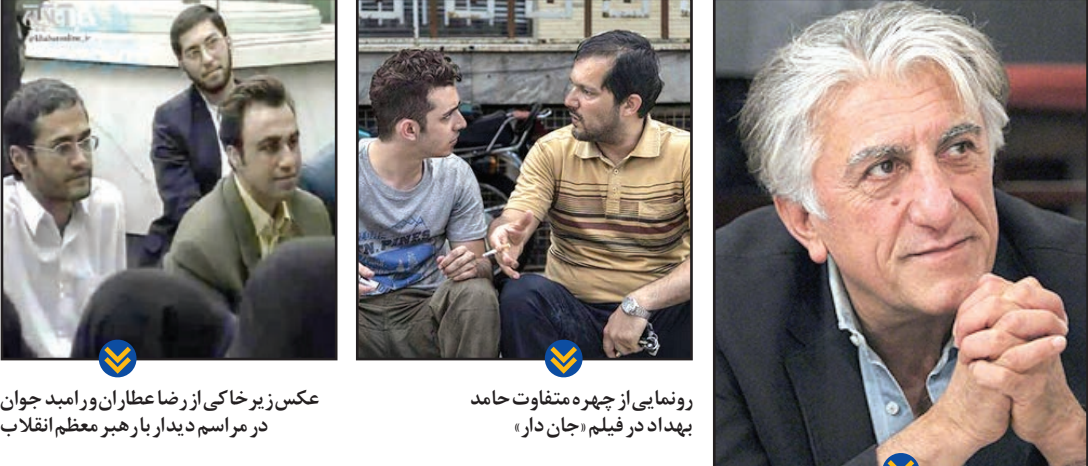
عکس زیر خاکی از رضا عطاران و امجد جوان در مراسم دیدار بار هبر معظم انقلاب