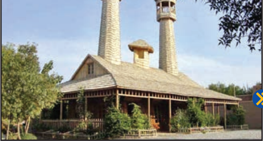
عکسی زیبا از دهکده چوبی نیشابور