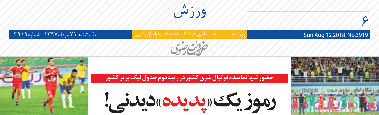
عکس ها و عکاس