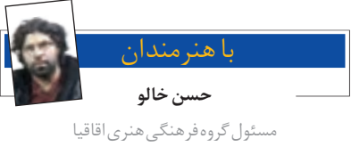
مسئول گروه فرهنگی هنری اقاچیا