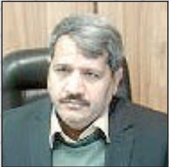
کلاته/مدیر امور آب ناحیه سبزوار گفت: از ابتدای امسال تاکنون با