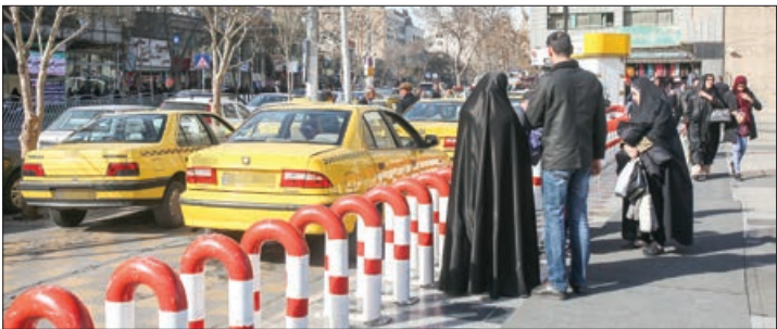
گزارشی از گلا یه های مردم در باره تا کسسی های اطراف حرم رضوی