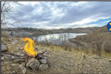
«باکلان» نمونه‌ای از تنوع زیستی در نیشابور