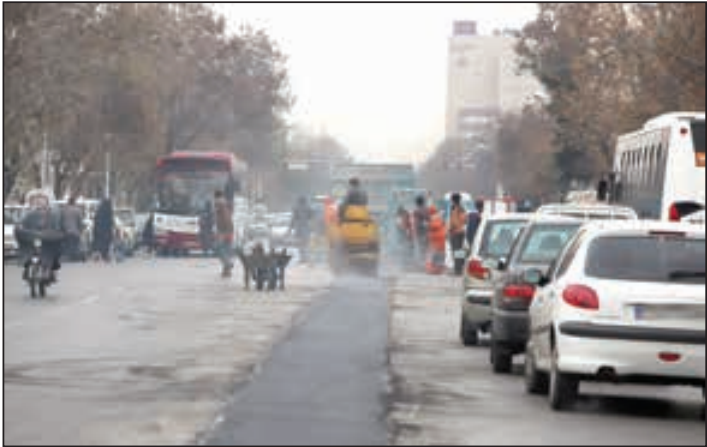
خط ۳ بی آر تی

پلیس راهور: پس از بازدید و تایید پلیس، اجازه نصب نرده‌ها را می‌دهیم