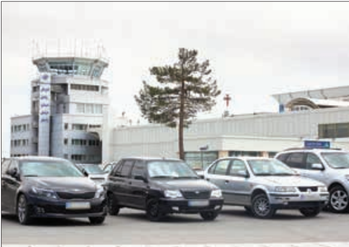
عصر صادق پنج

جلسه دو روز پیش کمیسیون نظارت مطرح و در نتیجه مقرر شد کمیته کارشناسی، نرخ گذاری کمیسیون در خواست را بررسی کند. وی تأکید می کند: ظرف دو، سه روز آینده (تا پایان هفته) و پس از اعلام نظر نهایی کمیته نرخ گذاری، نرخ مصوب کمیسیون نظارت در باره این پار کینگ اعلام می شود.