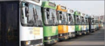
عصر صادق پنج

اتوبوسرانی: حق با اهالی است اما فعلا کاری نمی شود انجام داد