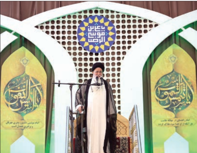
نماز جمعه مشهد