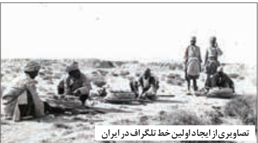
تصاویری از ایجاد اولین خط تلگراف در ایران