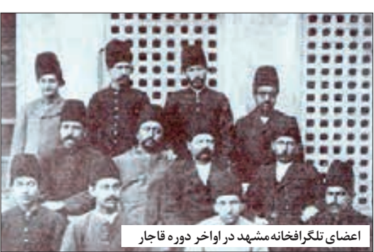
اعضای تلگرافخانه مشهد در اواخر دوره قاجار