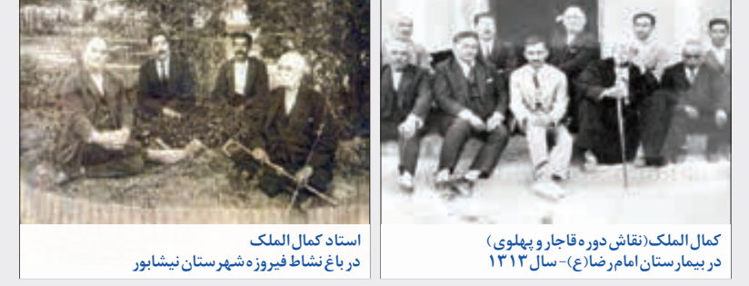
کمال الملک(نقاش دوره قاجار و پهلوی) در بیمارستان امام رضا(ع) - سال ۱۳۱۲

آقا حیف است که این شکار را از دست بدهیم، این کت و شلوار خیلی بیشتر از این ارزش دارد. دیگری حرف او را قطع کرد و گفت: حالا که به ما صد و هشتاد تومان کمتر