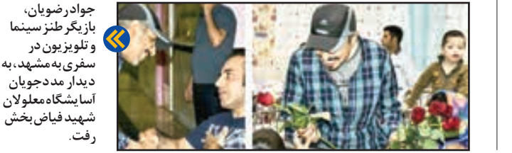
جواد رضویان، بازیگر طنز سینما و تلویزیون در سفری به مشهد، به دیدار مددجویان آسایشگاه معلولان شهید فیاض بخش رفت.