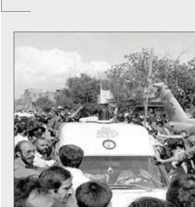
تشریم تیرماه سال ۱۳۶۰ مصادف است با حادثه ترور نافرجام حضرت آیت... خامنه‌ای از سوی گروهک فرقان در مسجد ابودر. این عکس از حواشی آن واقعه منتشر شده است.

روزنامه خراسان ر ضوی: رتبه یک نشریات استانی