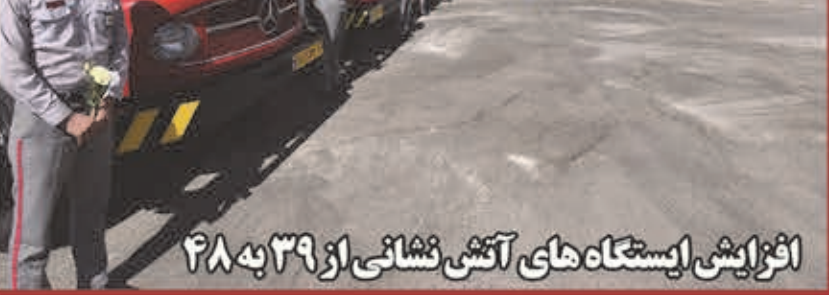
افزایش ایستگاه های آتش نشانی از ۳۹ به ۴۸