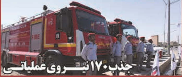
جذب ۱۷۰ نیروی عملیاتی