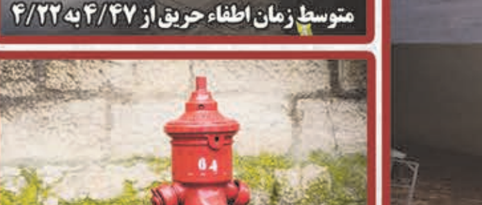
افزایش شیرهای هیدرانت از ۵۰۶ به ۷۱۹