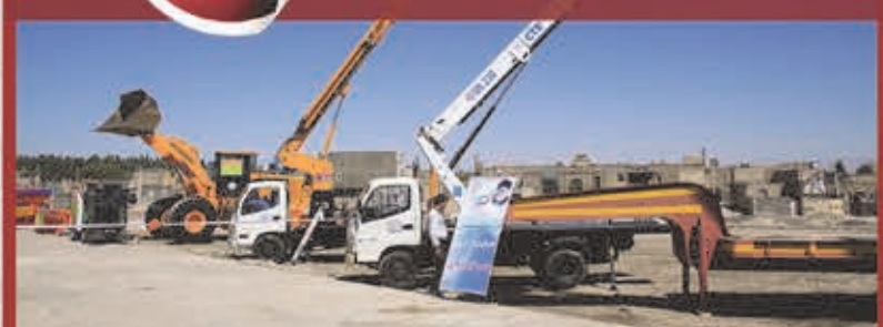
افزایش ناوگان عملیاتی از ۲۲۶۵ به ۲۶۷