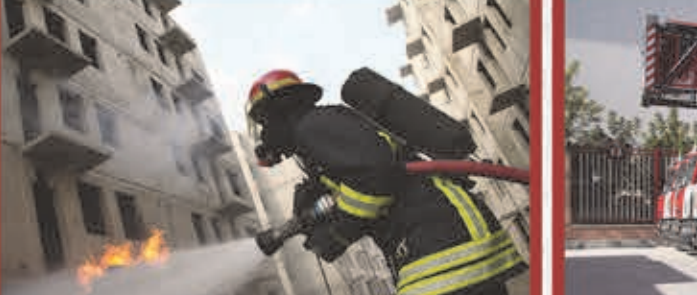
متوسط زمان اطفاء حریق از ۴/۴۷ به ۴/۲۲