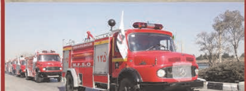
افزایش ناوگان عملیاتی از ۲۲۶۵ به ۲۶۷