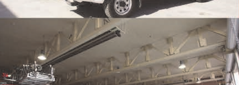
افزایش خودروهای دارای نردبان پلت فرم از ۶ به ۱۱