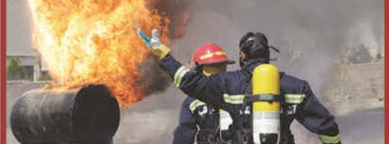
کنترل زمان رسیدن به حریق ۴/۱۹ دقیقه