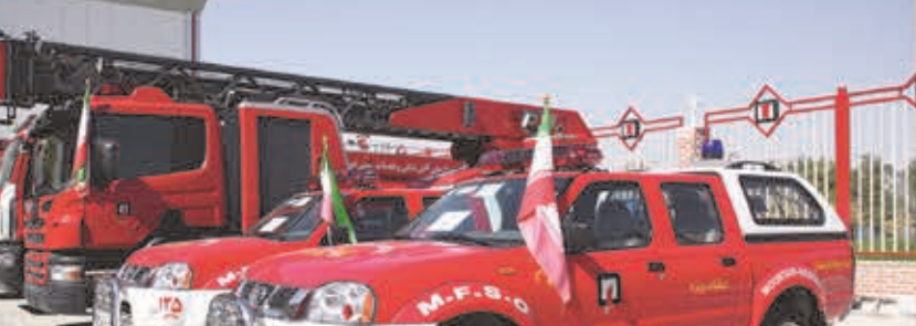
افزایش ایستگاه های آتش نشانی از ۳۹ به ۴۸