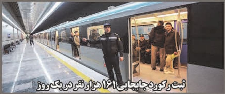
ثبت رکورد جایابی ۱۶۱ هزار نفر در یک روز