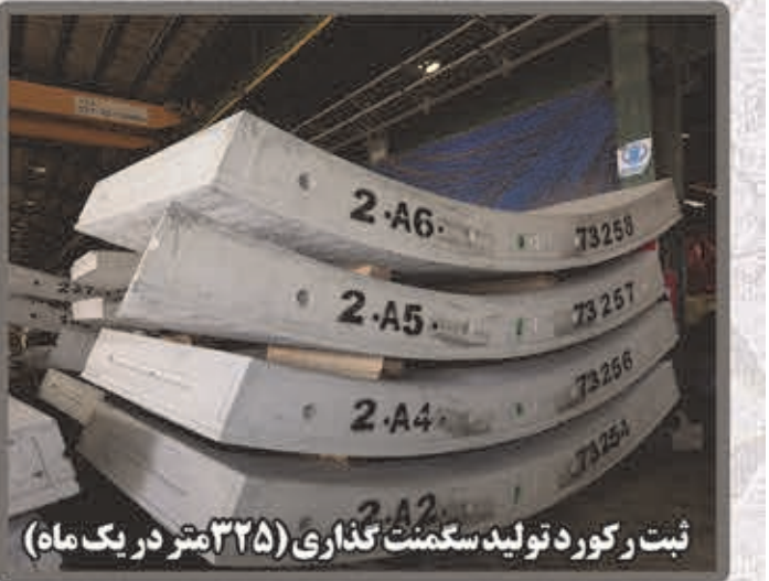
ثبت رکورد تولید سکمت گذاری (۳۲۵ متر در یک ماه)