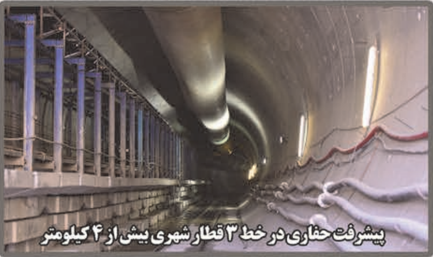
پیشرفت حفاری در خط ۳ قطار شهری بیش از ۴ کیلومتر