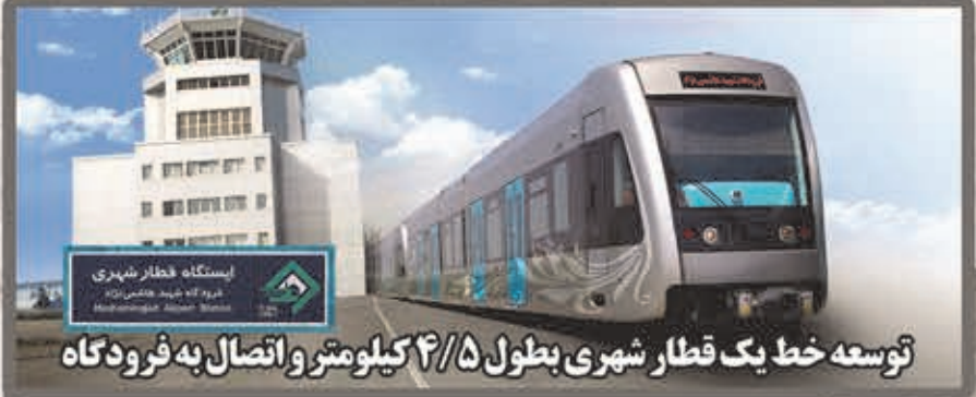
توسعه خط یک قطار شهری بطول ۵/۴ کیلومتر و اتصال به فرودگاه