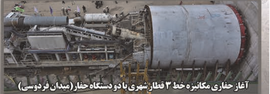
آغاز حفاری مکانیزه خط ۳ قطار شهری با دو دستگاه حفار (میدان فردوسی)