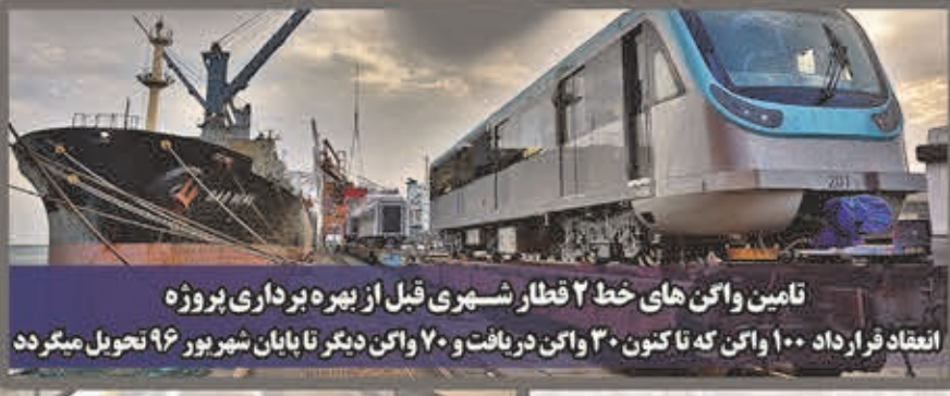
تأمین واگن های خط ۲ قطار شهری قبل از بهره برداری پروژه انعقاد قرارداد ۱۰۰ واگن که تا کنون ۳۰ واگن دریافت و ۷۰ واگن دیگر تا پایان شهریور ۹۶ تحویل میگردد