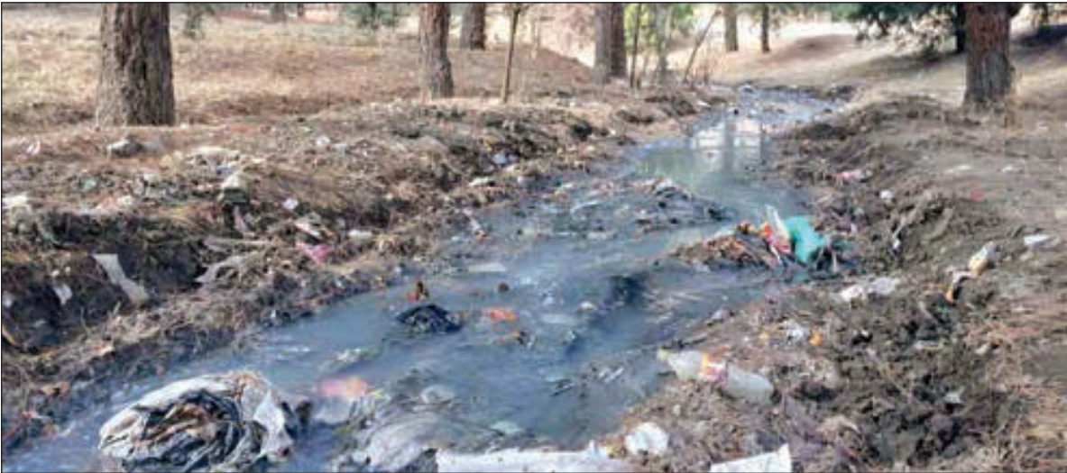
قلاب‌های پلاستیکی و زباله‌های پلاستیکی در کنار یکدیگر