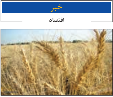
استاندار با اشاره به آمار مقایسه‌ای ۲ سال زراعی گذشته