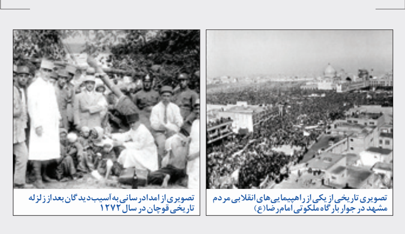
تصویری تاریخی از یکی از راهپیمای‌های انقلابی مردم مشهد در جوار بازگاه ملکوتی امام رضا(ع)