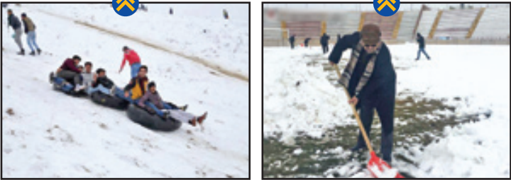
یکی از عکس‌هایی که در پروز در شبکه‌های ورزشی دست به دست می‌شد، این تصویر از پارو به دست شدن مالک باشگاه سیاه جامگان بود.

بخش زیادی از فضای شبکه‌های اجتماعی در روز مشهد به عکس‌های برف‌بازی شهیدی‌ها و تفریحات زمستانی آن‌ها اختصاص داشت.