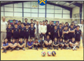
فرهاد ظریف هم پست و ویژه صفحه شخصی خود را به امیدهای آینده و ایالال کشور اختصاص داد.