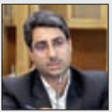
مدیر کل دفتر هماهنگی امور اقتصادی