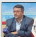
دبیر کل کانون انجمن‌های صنفی کارگران