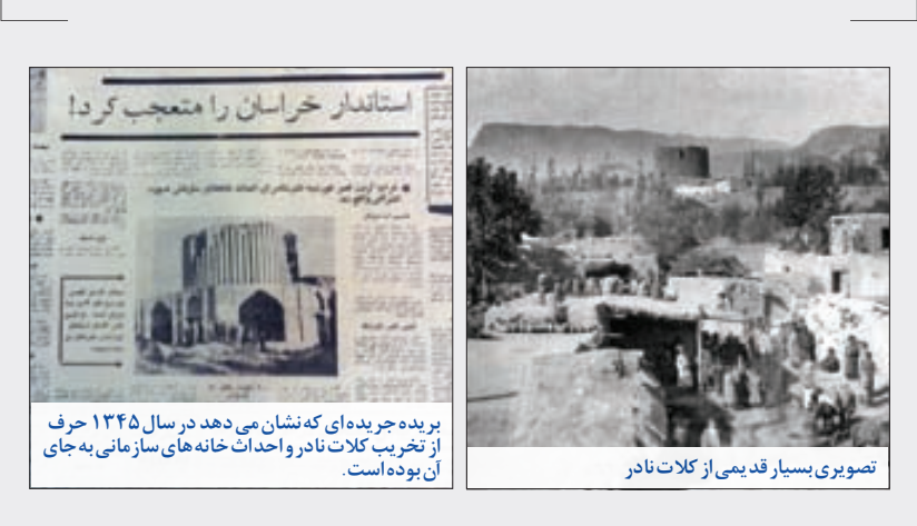
تصویری بسیار قدیمی از کلات نادر