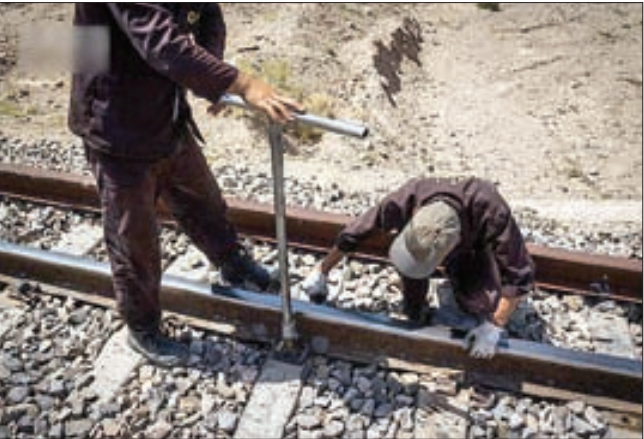
کارگران راه آهن