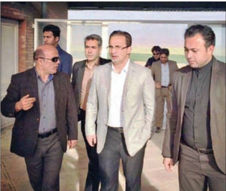
یکی از اعضای ورزش در قوچان

این در حالی است که قرار بود پروژه، ۳۰ ماهه آماده وتحویل داده شود.