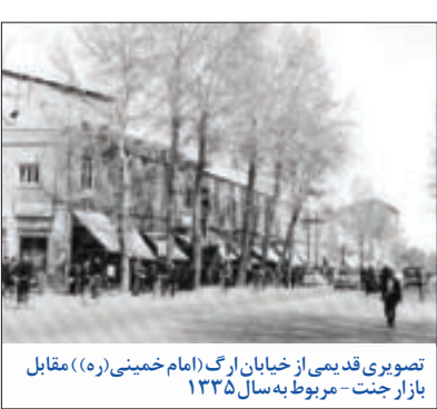
تصویری قدیمی از خیابان ارگ (امام خمینی(ره)) مقابل بازار جنت - مربوط به سال ۱۳۳۵

● آگهی نرخ نان با گندم آزاد مشهد؛ آگهی‌واره ده – مردم مشهد! پیرو آگهی شماره ۹۵۲۵/۲۸۸۵ جلسه کمیسیون تجدید نظر در نرخ نان آزاد، اوایل هفته با حضور چند نفر از معتمدین شهر ۵۰ نفر معتمدین ناواهای شهر جلسه‌ای در شهرداری تشکیل شد و پس از رسیدگی به هزینه و درآمد فروش ۱۵۰ مَن گندم، مقرر شد از روز شنبه آنی، قیمت یک مَن نان گندم آزاد، با آزاد گندم آبی، از قرار ۱۴ ریال باشد. کلیه نانوا یی‌های مشهد موظفند نرخ مقرر را رعایت نمایند و در صورت تخلف و تجاوز، برابر قانون کیفری گرفتارن‌روشان