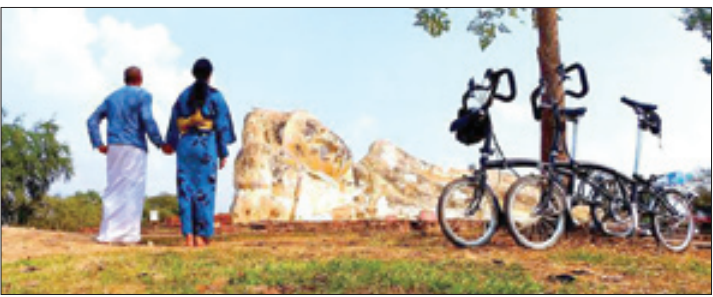
عکسی از سفر این زوج جهانگرد به ایران گستان

❖ خاطراتی ماندنی از میهمان‌نوازی ایرانی‌ها ۱۵ سال پیش، ذهنیتم از ایران همانی بود که رسانه‌ها نشان می‌دهند. یک کشور پر آشوب و درگیر جنگ‌وانامنی اما کمی بعد، یک زوج مسن ایرانی میهمان من شدند که نگرشم را به کشور شما به‌طور جدی تغییر دادند البته تحول در باورم به این آب و خاک، زمانی اتفاق افتاد که از نزدیک محبت مردمانش را دیدم. اما برای کا، «ایران» تا پیش از این تعریف دیگری داشته‌است؛ «من کشور شمارا در موزه لندن شناختم. در آنجا، یک بخش بزرگ‌وویژه به ایران و فرهنگ آن تعلق دارد. میرانی که در آنجا به نمایش درآمده، شگفت‌انگیز است و همیشه دوست داشتم که کشورتان را از نزدیک ببینم. این وسط، بخشی از آشنایی من با ایران به آثار کارگردانان ایرانی همچون عباس کیارستمی و مجید مجیدی نیز برمی‌گردد که مشترکات فرهنگی زیادی را میان ایران و ژاپن به نمایش گذاشتند.»