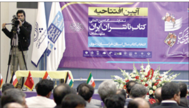
عکس از شهید