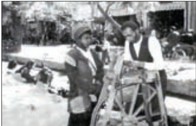
عکسی مربوط به سال ۱۳۳۶ هجری شمسی - روایتی از حرف‌های قدیمی (به طر ف دروازه فوجان، چافو طیز کنی کنار خیابان.)

سبزوار؛ خبرنگار خراسان – بنابه‌دعوتی که از طرف اداره فرهنگ سبزوار به عمل آمده بود، آقایان رؤسای ادارات و