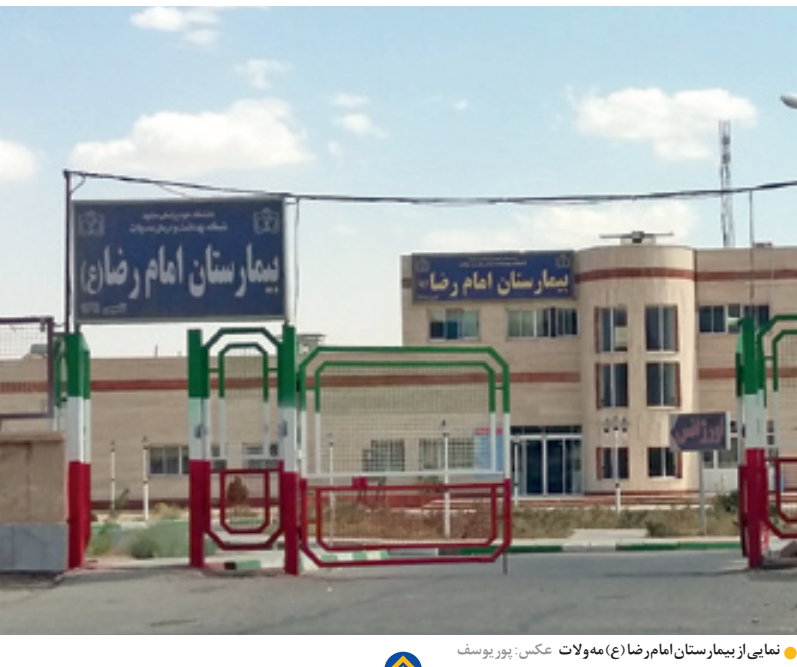
نمای از بیمارستان امام رضا (ع) مه ولات

معاونت درمان دانشگاه علوم پزشکی تربت حیدریه : بیمارستان مه ولات آذر ماه با اولویت های بخش های داخلی و اطفال راه اندازی می شود