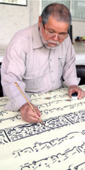
عید و میزبان

● خطاطی دور سقاخانه صحن قدس حرم او از حضور در نمایشگاه های مختلف جهان برایمان صحبت می کند و در همین حال کتابی را نشانم می دهد که حاکی از حضور اثر خوشنویسی اش در نمایشگاه خطاطی لندن در سال ۱۳۵۴ است. از جمله افتخاراتش هم خطاطی دور سقاخانه صحن قدس در حرم مطهر رضوی و همچنین کار روی کتیبه های مسجدی در هامبورگ آلمان است. او از عشق و علاقه خود برای کتابت قرآن کریم از همان ابتدای سال های جوانی اش برایمان تعریف می کند و می گوید: کتابت قرآن کریم را از همان سال ها که در موزه آب انبار تهران مشغول کار هنری بودم، آغاز کردم اما بعد از مدتی به قوچان و سپس به مشهد آمدم.