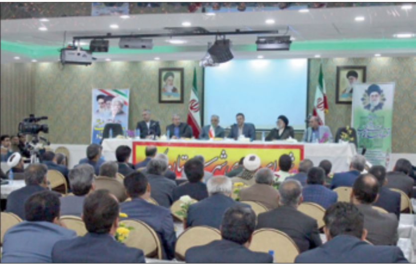
مراسم تودیع و معارفه فرماندار کاشمر

هر کسی که در راستای این نظام و برای تحقق اهداف و خدمت به مردم تلاش کند حمایت می کنیم، حجت الاسلام سید قاسم توصیه می کنم با توجه به سیاست های ابلاغی رهبر معظم انقلاب، با تعهد و تعامل با مجموعه آستان قدس رضوی کاشمر را به نقطه مطلوب و مد نظر برسانند. وی با بیان این که گفتمان اعتدال، یک گفتمان جناحی و جریان‌ی نیست بلکه یک مکتب فکری است تصریح کرد: امیدواریم همه استعدادها با هر گرایش سیاسی با موضوع مشترک اعتدال و عقلانیت به میدان بیایند و در این حوزه کمک کنند.